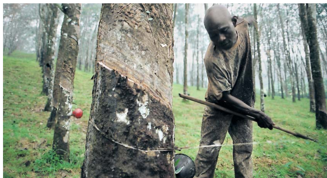
Chaque ouvrier, employé par Firestone sur la plantation de Harbel au Libéria, est chargé de la récolte de latex sur environ 800 arbres.

LIRE PAGES 3 ET 5 ET NOTRE ÉDITORIAL PAGE 2